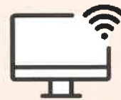
インターネットバンキング など